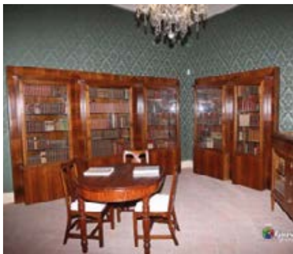
La Biblioteca di Palazzo Alfieri