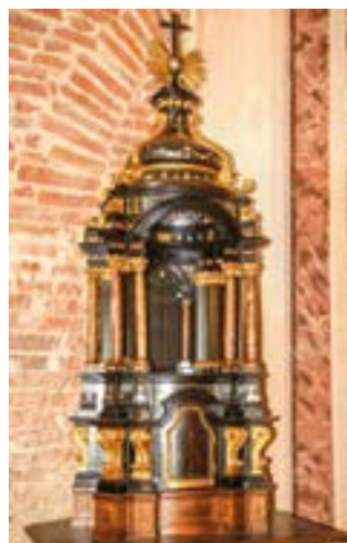
Tabernacolo in ebanisteria Astigiana