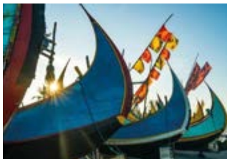
Barche da pesca - Bangladesh