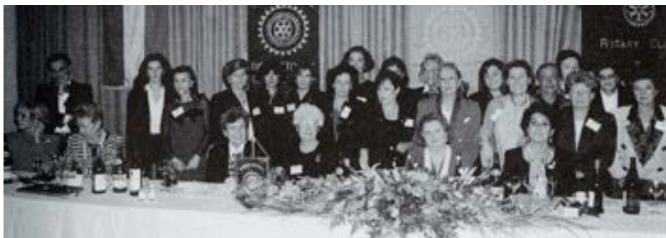
18 ottobre 1995 - la consegna della "Charta"