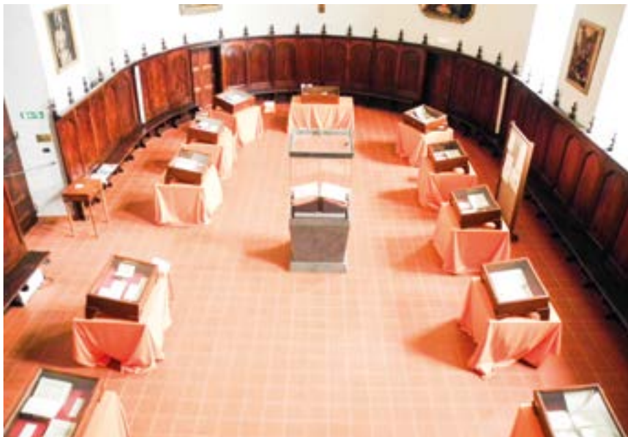
Il Refettorio del Seminario Vescovile