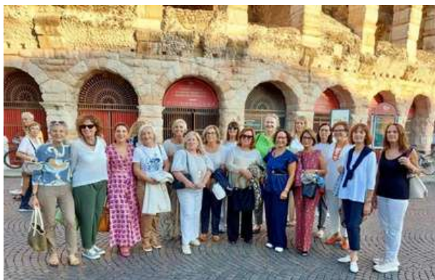
Foto di gruppo davanti all’Arena di Verona! Prima di raggiungere Castelvechio per la cena dell’amicizia, la Governatrice e le socie degli IWC hanno condiviso un momento speciale in un luogo così iconico e suggestivo. Un ricordo bellissimo di una giornata dedicata alla cultura, alla convivialità e alle nostre preziose amicizie!

Castelvechio, costruito a metà del Trecento per volontà di Cangrande II della Scala, signore di Verona, il castello non era solo una residenza fortificata ma anche un rifugio strategico contro possibili rivolte interne e attacchi esterni.