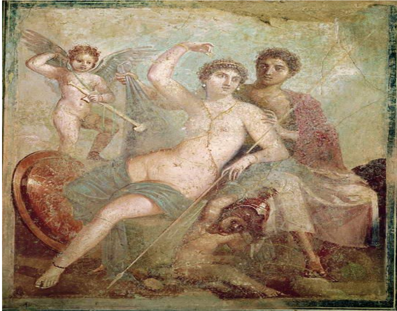
“MARTE E VENERE” DALLA CASA DI MARTE E VENERE” POMPEI (DIPINTO MURALE)

AGENDA EVENTI DEI CLUB _ MESE DI MARZO 2024 ROBERTA DE PASCALIS RACANIELLO EDITOR