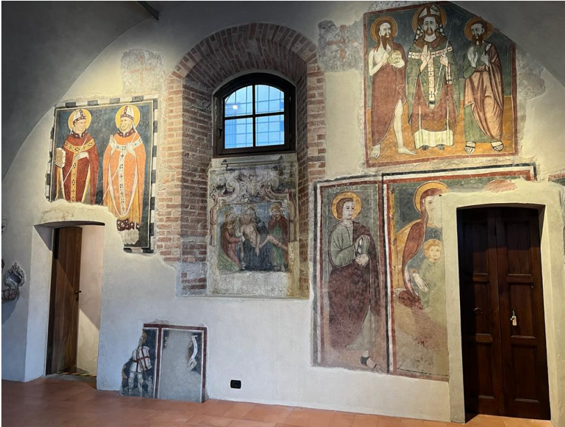
Alcuni affreschi della tribuna.