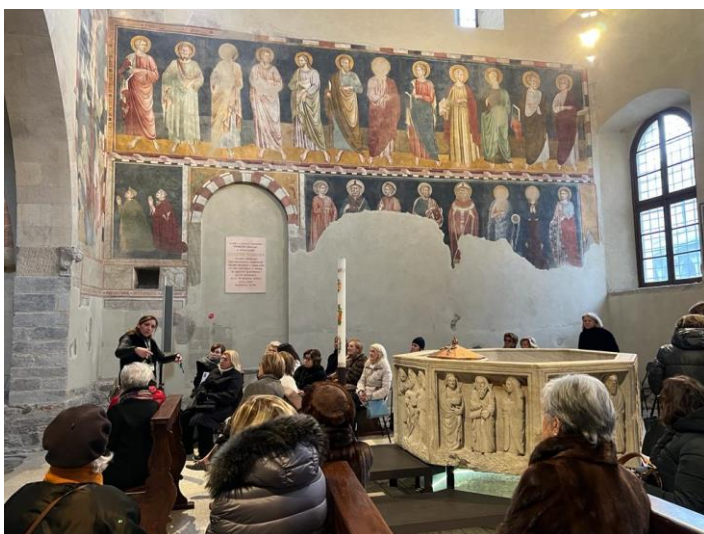
Il Battistero, la Vasca Battesimale ottagonale in pietra del 1320 e gli affreschi.

A fianco della Basilica, il Battistero di San Giovanni Battista, focus del nostro giro. E' questo il cuore medievale di Varese il più antico monumento della città, che ospita interessanti affreschi dell'anonimo Maestro della Tomba Fissiraga. Ammirevoli la tribuna superiore riccamente affrescata e le due lunette sopra i portali, anche queste restaurate dal nostro I.W.club.