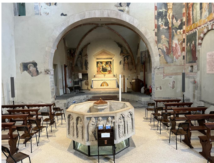
Il Battistero. Sulla parete di fondo una raffinata Madonna col Bambino.