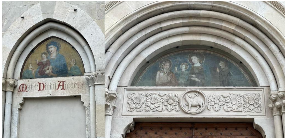
Le due lunette frutto del restauro dell'I.W.Club di Varese e Verbanò (1999-2000/2000-2001)