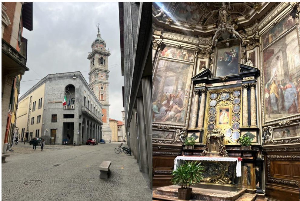
Il Bernascone sullo sfondo. In alto, purtroppo poco visibile, le tela restaurata dall'I.W.C.di Varese e Verbano con la Vergine che porge il S.Rosario a San Bernardo.