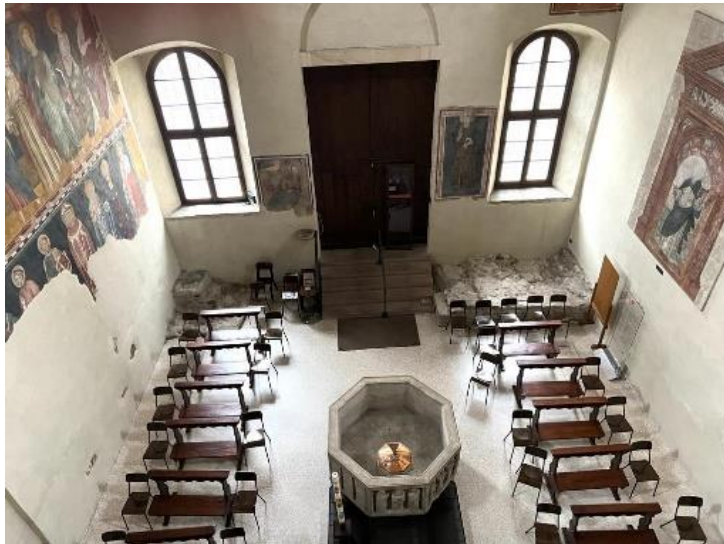
Il Battistero visto dall'alto.