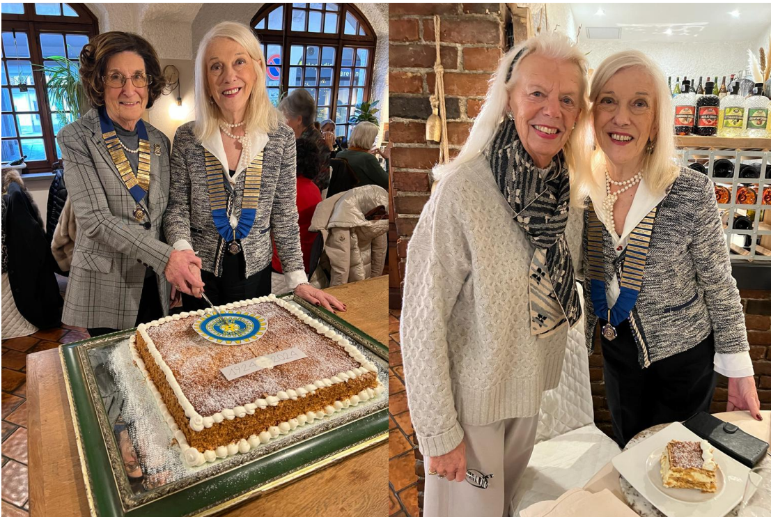
Le Presidenti Inner Wheel tagliano la torta di compleanno.