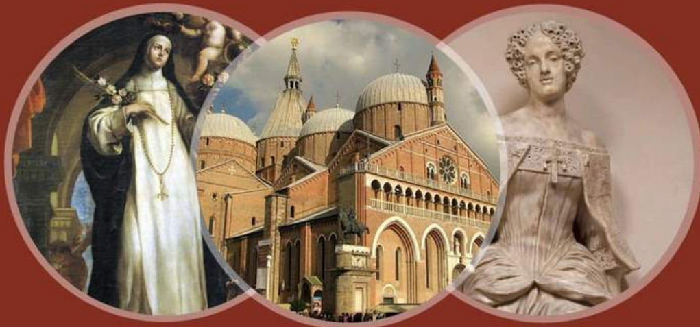
FIGURE FEMMINILI NELLA BASILICA DI SANT'ANTONIO [PD]

Alla scoperta delle figure femminili che hanno trovato sepoltura o memoria eterna presso la Basilica del Santo di Padova; onore, questo, nei secoli passati riservato quasi esclusivamente agli uomini.