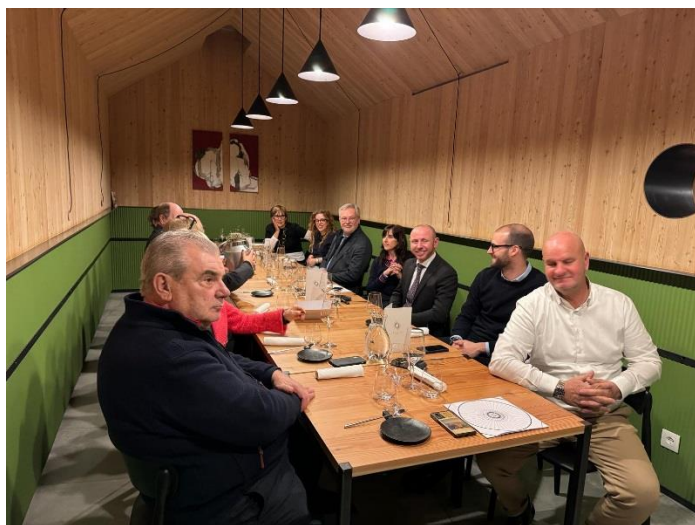
I partecipanti alla serata