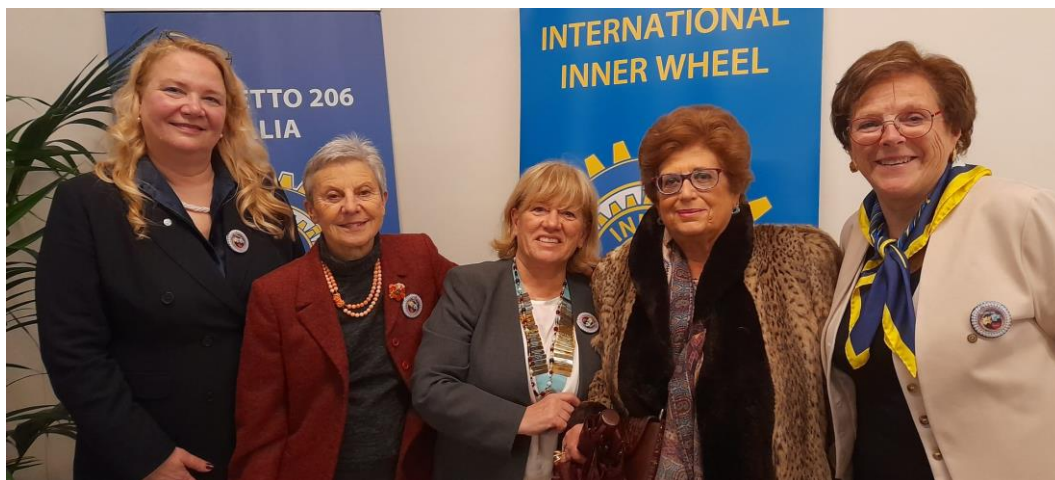
Il Club di Trento con la Governatrice Isabella e la Presidente Nazionale Cucca