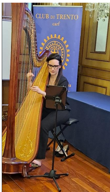
Il duo Paola e Chiara