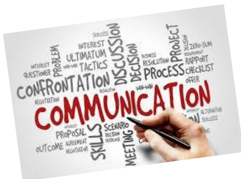
Addetta Stampa 2023-2024