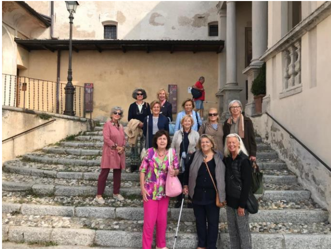
Lungo la scalinata verso il Santuario.