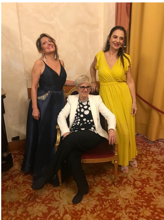
Le protagoniste del concerto sorridenti dopo gli applausi.

Care amiche anche ottobre è andato e con lui un'estate anomala che ha lasciato posto ad un autunno bislacco: piogge, inondazioni e temperature in picchiata in una parte dell'Italia e caldo estivo nell'altra. Ormai, dato che anche i meteorologi più esperti si muovono con estrema cautela, noi viviamo alla giornata accettando quello che viene.