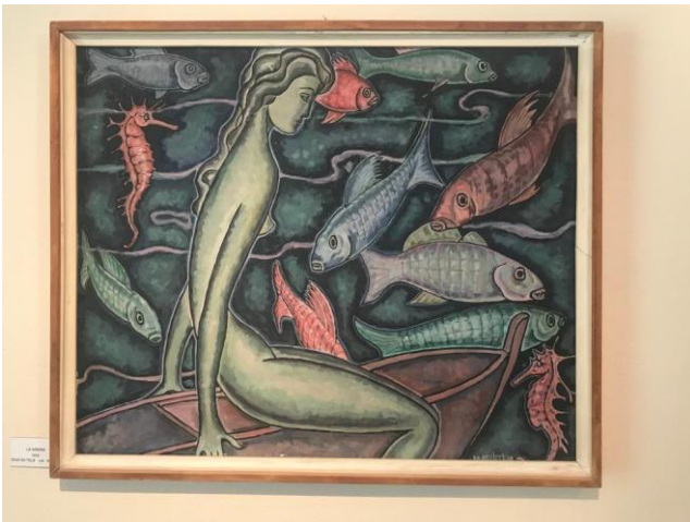
Una magica "Sirenetta".

Regalando questo quadro "La costruzione del marito ideale" alla nuora, osservò che lui ne aveva costruito una parte, a lei pensare alla testa!