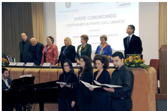
Onore alle Bandiere – Il coro