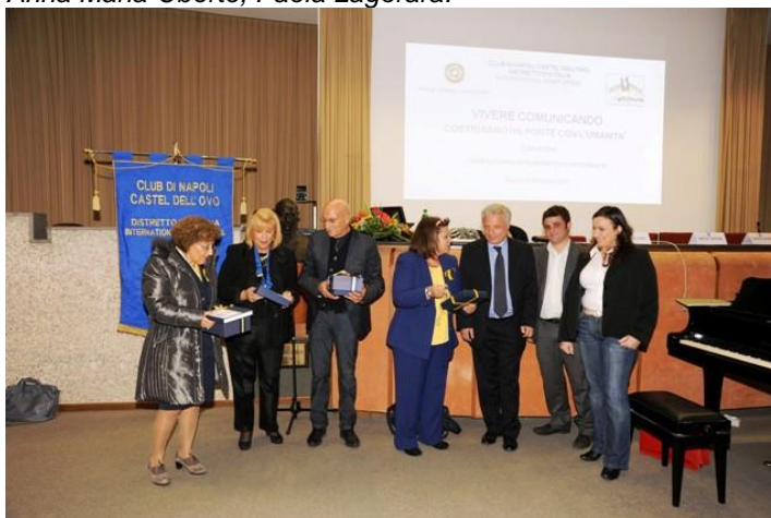
Relatori e Moderatori del Convegno

Questo Service, di grande valore umanitario per le ragioni ideali che lo ispirano ed i risultati concreti cui è destinato, non si esaurisce in questa fase perché il Club, lavorando ancora nell'ambito della comunicazione, si propone di privilegiarne gli aspetti positivi e, neutralizzandone quelli dannosi, di utilizzarla al meglio per stimolare le relazioni umane, attuando un programma pluriennale rivolto agli adolescenti e alle donne.