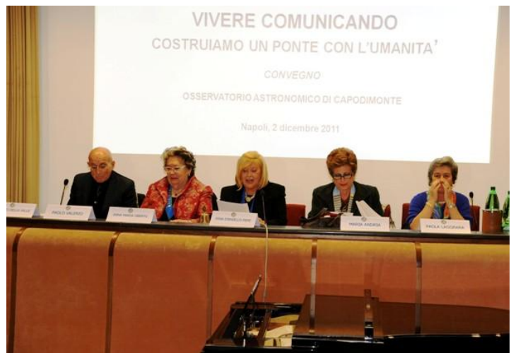
tavola tonda, è entrato nel vivo con la prima sessione: